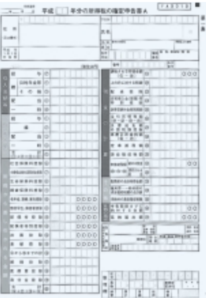
使用する確定申告書の種類(申告書A)