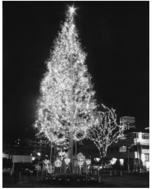
カラーでお見せできませんが、会場でお楽しみください。寒いので防寒十分に！

海老名の冬の風物詩「第12回えびなウインターイルミネーション」は、1月10日(金)まで開催します。会場はe-CAT(海老名駅東口企業送迎車両ターミナル)ザウイングス前、点灯時間は午後5時から午前0時までとなっております。新春の夜空に輝く光のファンタジーをお楽しみください。