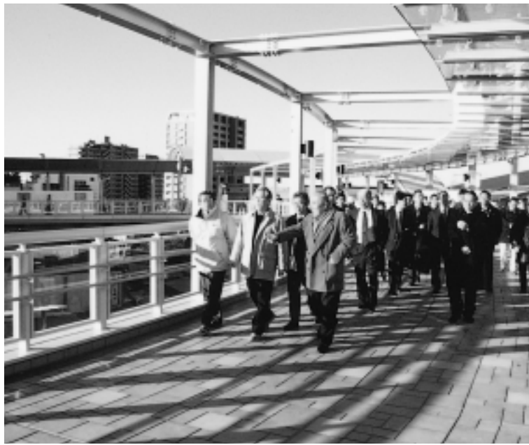
市長らの北側自由通路のわたり初め。ぐるっと一周できます