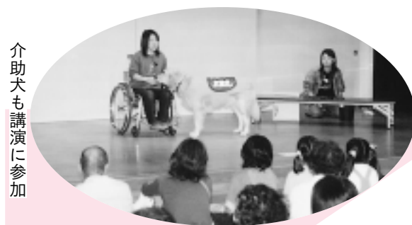
介助犬も講演に参加