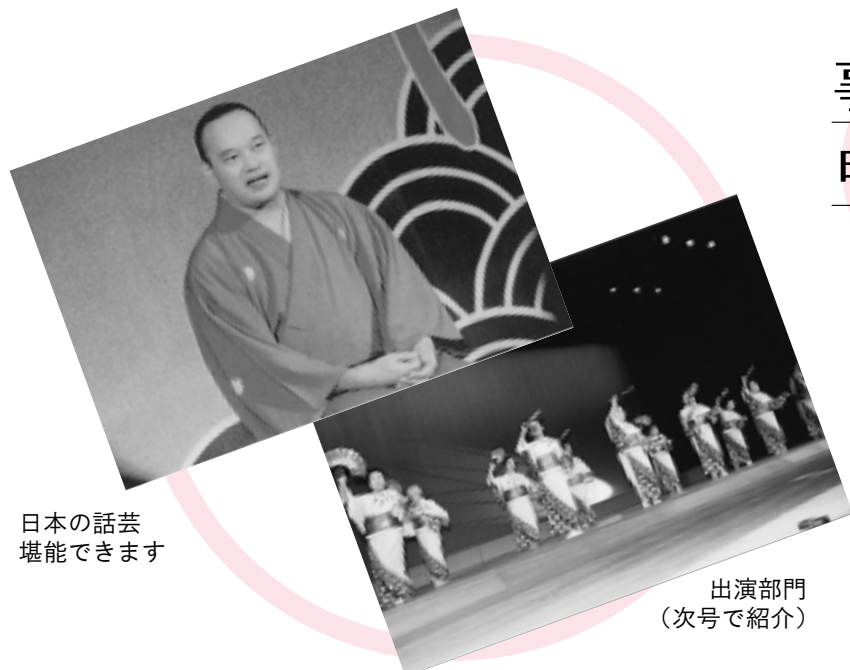
日本の話芸堪能できます

ボランティアや施設従事職員、社会福祉功労者など、社会福祉に貢献された方を表彰します。