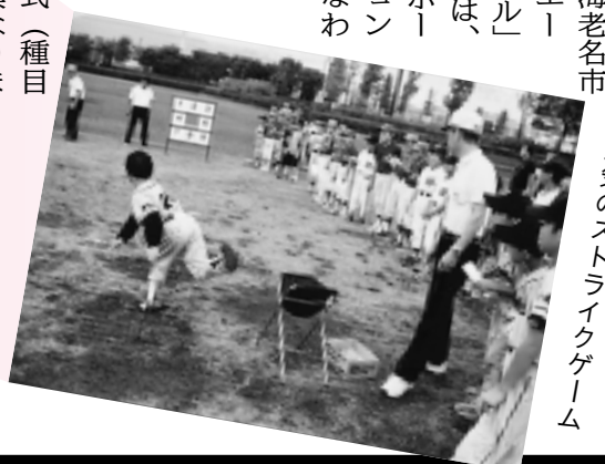
人気のストラップゲーム

10月11日(祝)海老名運動公園で「第6回海老名市スポーツ・レクリエーションフェスティバル」を開催します。当日は、県主催「かながわスポーツ・レクリエーション大会」も同時に行なわれます。盛りだくさんのイベントにご参加ください。