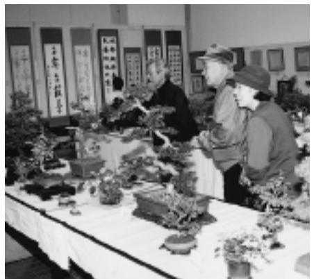
展示部門(次号で紹介)

▽日時 11月14日(日) ①午前10時～11時30分、②午後2時～3時30分、▽内容 クマのスーさん「スーさんとはちみつ」シートン動物記「森を守る小さな赤