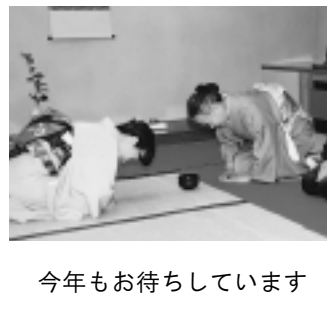
今年もお待ちしています

▽日時 11月6日(土) 午後2時～3時、▽対象・定員 年齢不問・100人、無料。