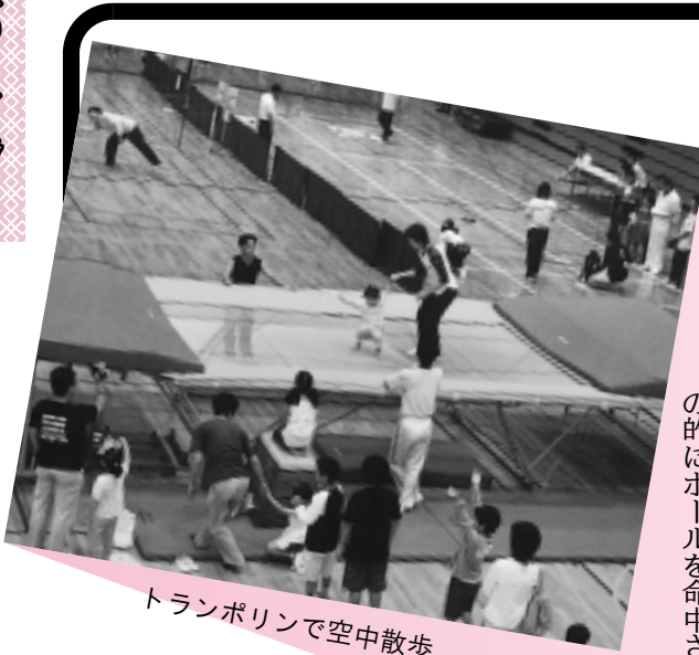
トランポリンで空中散歩

10月11日(祝)午前9時30分から陸上競技場で開会式(種目により実施時間が異なります。雨天の場合、中止になる種目あり)。 ▼チャレンジ種目 参加された方には記録証を発行。 ●エースをねらえ！(テニスサーフコンテスト) ●豪球一直線(野球スピードガンコンテスト) ●強肩三球勝負(ソフトボール) ●手投げ遠投コンテスト) ●ストライクゲーム(9枚的のボールを命中させる) 【持ち物】 ①昼食等(公園内に軽食売店あり) ②運動のできる服装(総合体育館は、室内シューズが必要です)。 【交通】 小田急線・JR相模線の厚木駅から徒歩13分。 ※駐車場の混雑が予想されますので、電車等を利用してください。 ●海老名市スポーツレクリエーションフェスティバル実行委員会事務局(1階スポーツ課)。