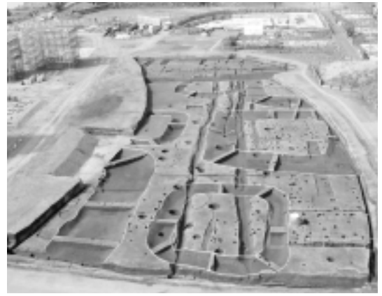
「社家宇治山遺跡」の全景