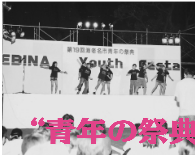
今年も市役所で開催する祭典(資料)

①。また、市内2カ所(保育園)での土壌中ダイオキシン類調査でも環境基準を下回っていました。中小河川の水質は、BOD(生物化学酸素要求量。大きい値ほど汚染度が高い)などについて調査しました。主な河川は改善傾向にあり、特に目久尻川で良好になりました。②。地下水調査では、東柏ヶ谷地内の井戸と過去にトリクロロエチレンが環境基準(0.03mg/L)を超過した杉久保地内にある井戸を継続