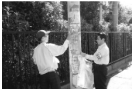
違反屋外広告物を撤去する協力員

市では、まちの景観を乱す違反屋外広告物(はり紙・はり札・立看板)を積極的に撤去する協力員(ボランティア)を募集しています。 ▽対象 市内在住・在勤の18歳以上で、屋外広告物