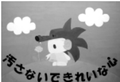
石川友紀さんの作品