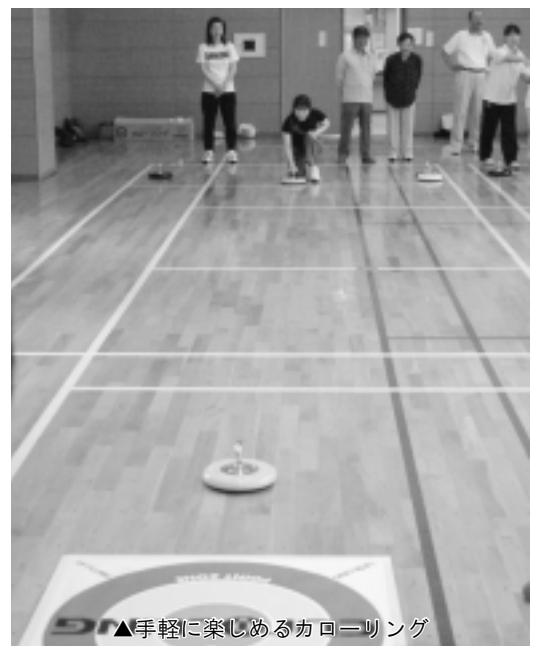
▲手軽に楽しめるカローリング

カローリングは、水上で 行うカローリングをフロアー で手軽に楽しめるように考 えられたスポーツです。 簡単なルールと使いやす い用具で行い、特別な技術 や力は不要です。 ▽日時 10月28日(金) 午前10時～正午 ▽集合 午前9時45分 ▽会場 下今泉コメセン 体育室