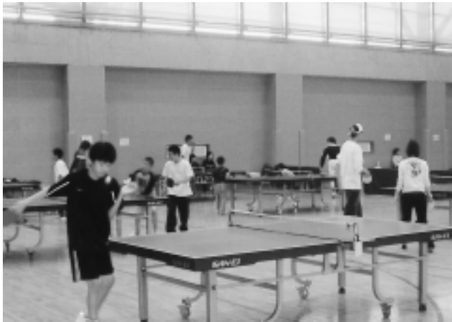
▲体育館では、卓球のほかバドミントンなども楽しめます

市では、スポーツの高揚 と家族や友達のコミュニケー ションの場として、海老名 運動公園の3施設と北部公 園の2施設を無料開放しま す。