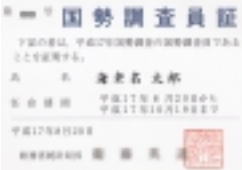
▲ 調査員が直接各世帯を訪問します ◀ 調査員が携帯する「国勢調査員証」

国勢調査って何？ 国勢調査は、「統計法」に基づき日本国内の人口や世帯、就業者からみた産業構造などの状況を明らかにする統計を得るために行われる、国の最も基本的な統計調査です。 この調査の結果は、地方交付税を配分するための基礎資料や福祉施策・雇用政策・防災対策・都市整備計画などの各種行政施策に欠くことのできない資料として利用されます。