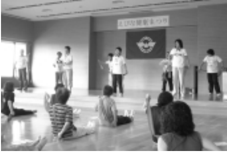
ゴムバンドを使って健康体操

生活習慣病などの予防・対応策を楽しみながら学ぶ、健康保持・増進に役立てましょう。