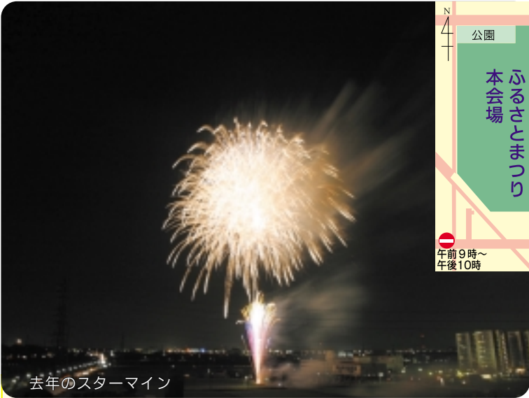
去年のスターメイン