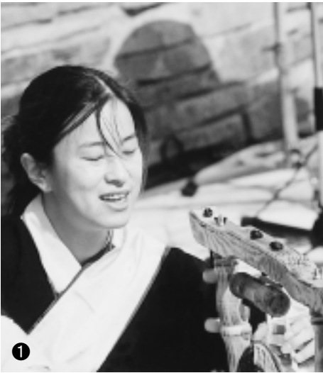
① 去年のえびな平和国際交流展から ② カンボジア ③ 海老名ささら踊り