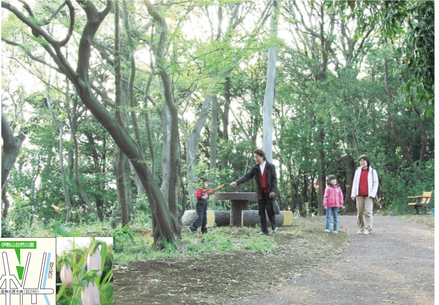
木もれ日の中で散歩を楽しめる伊勢山自然公園