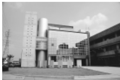
文化会館小ホール

得を得られる選定(指定には議決が必要)や毎年の事業報告に関する精度の高い確認方法など、運用実績を重ねながら充実しつつ、この新しい制度を効果的に活用してさらに市民サービスを向上させていきたいと思っています。