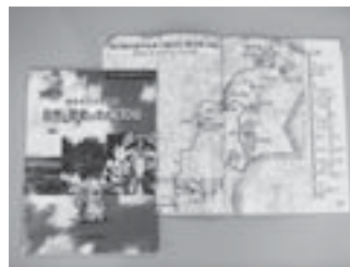
▲文化財や自然などの情報満載のガイドブック

市教育委員会では、市内の史跡や文化財、自然などの散策に便利なガイドブック「文化財散策 自然と歴史のさんぽみち」を刊行し