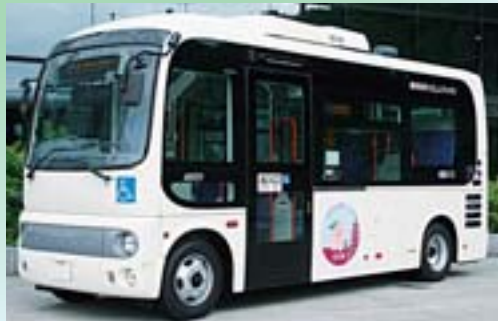
【下り 海老名駅西口発～かしわ台駅ゆき】 ※平日、土・日・祝日共に共通ダイヤで運行