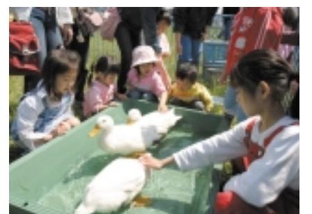
ミニ動物園も開設

市役所東側の田んぼの一部を、レンゲや菜の花畑として活用し、市民のみなさんが花と身近に親しむ場として「花のさとまつり」を開催します。 ▽日時 4月23日(日) 午前9時30分~午後3時 ▽内容 花の苗やたい肥の配布(緑化募金にご協力いただいた方(なくなり次第終了))。 ☎ 農政課農政担当。