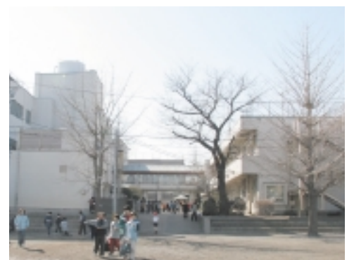
グラウンドから見た現在の校舎。左側が建て替える南棟

東柏ヶ谷小学校南棟の建替工事が本格化します。新しい校舎は、次代を担う子どもたちにとってより良い学習環境を整えることとはもとより、時代の流れとともに変わっていく社会のニーズに、柔軟に対応できるような施設を目指しています。