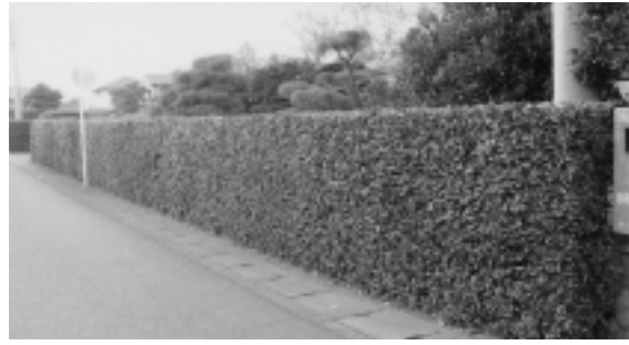
● 公園緑地課緑化担当