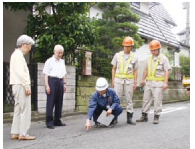
▲市職員が、道路の傷み具合を確認(国分寺台4丁目)

● 市道総延長は452キロ ～「幹線道路」「生活道路」に分けて整備～ 市内には、3・38キロの国道、33・68キロの県道と、41・73キロの市道があります。市道とは、市が整備と維持管理を行う道路で、市では市道を「幹線道路」と「生活道路」とに大別しています。 幹線道路は、市と近隣市町間や、市内地域間を結ぶ道路です。広域交通の円滑化と安全確保を目指して、ルートの選定や工事スケジュール設定など、整備事業に取り組んでいます。 生活道路は、毎日の生活で身近に利用する道路です。市民のみなさんからの要望などを基に、居住環境向上を目的に、整備を実施しています。