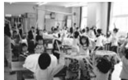
▲和太鼓教室の練習風景