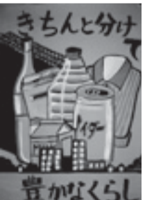
▲落合徳香さんの作品