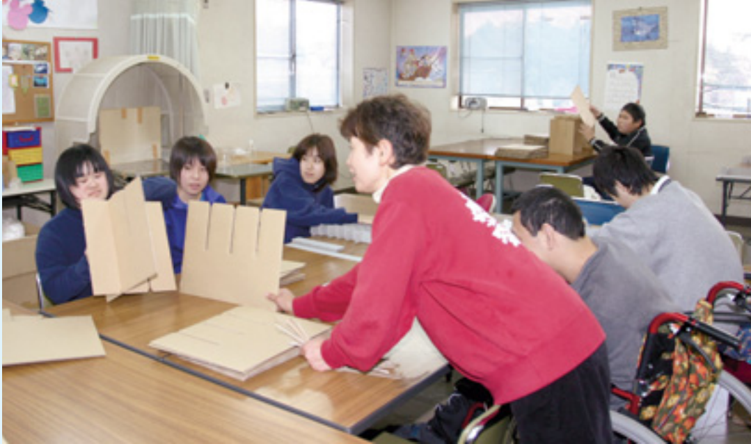
写真は11月28日、あきばデイサービスセンター(上今泉)。この日は海西中学校2年生2人が職場体験として、同センターに通う障がい者と一緒に、段ボールの組み立て作業などを行いました。

市内のデイサービスセンター(3カ所)では、障がい者の活動の場の提供や、地域住民との交流事業などを実施しています。