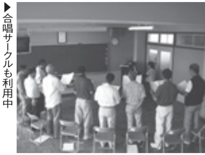
合唱サークルも利用中

市内在住・在勤または在学の方が半数以上の団体(団体登録が必要です) ▽教室を開放する学校(教室数) ▼柏ヶ谷小学校(1) ▼上屋小学校(1) ▼東柏ヶ谷小学校(4) ▼今泉中学校(1) ▽開放時間 ▼平日 18時～21時 ▼土日祝 ①9時～12時 ②13時30分～16時30分 ③18時～21時