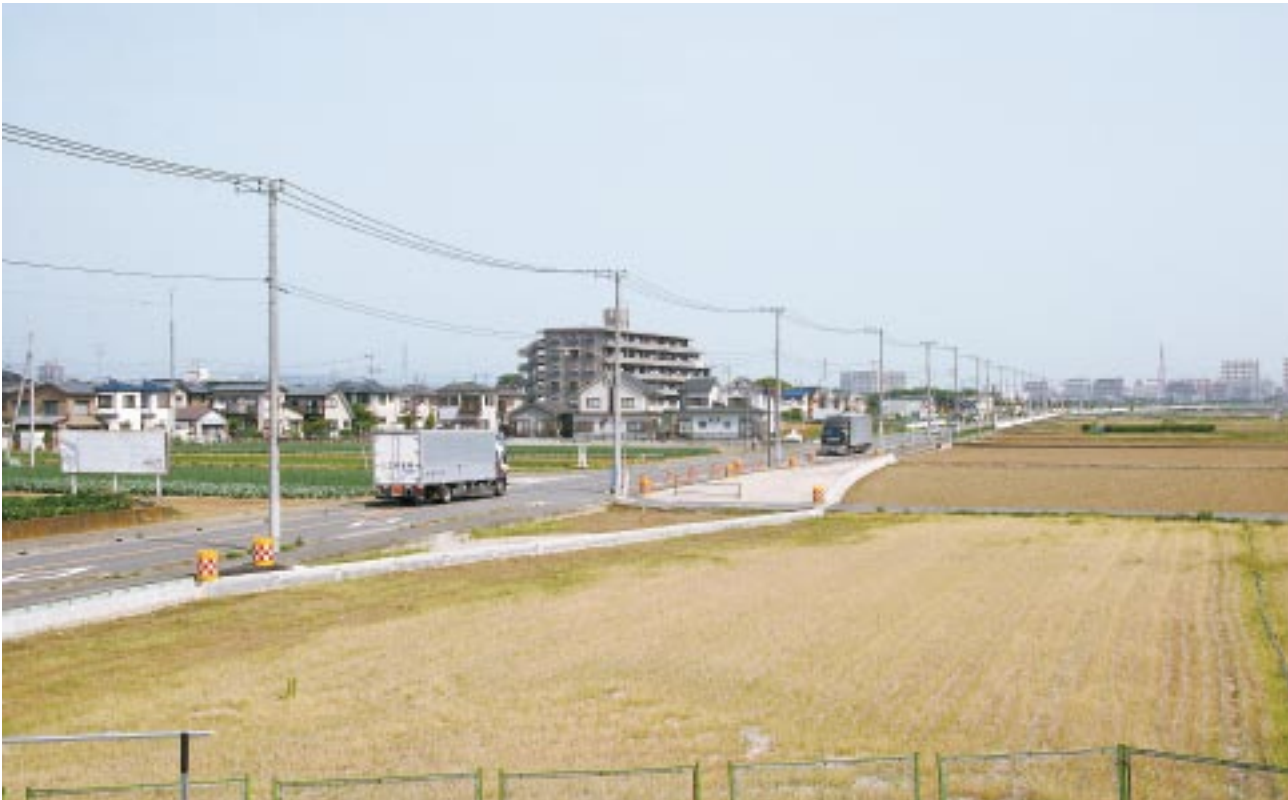
▲東名高速道路北側から望む、整備中の市道2544号線(南伸道路)。市南部から東名下部を貫通し、海老名駅前まで最短で結ぶ道路(市道528号線～市道海老名駅大谷線)に接続します

「あなたのフィールドへ。海老名市」 新政策・都市ブランドの創出事業を展開中！ 政策事業推進課 (☎235・4635)