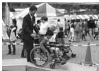
▲昨年の様子(出演部門)

「聴かせる太鼓」「魅せる太鼓」をモチーフに練習に取り組み、県立中央農業高等学校和太鼓部の演奏を披露します。太鼓の響きと大きな掛け声で、皆さんの心を