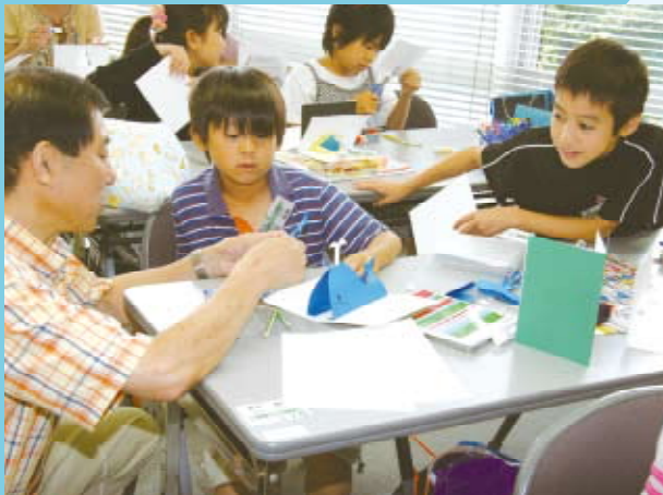
8月3日・5日、門沢橋コミセンで「手作りしかけ絵本教室」を開催。56人の小学生が、本を開くと仕掛けが飛び出す絵本を作りました。