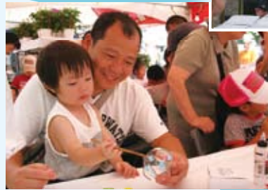
7月24日・25日、e-CAT(海老名駅東口企業送迎車両ターミナル)で「相模国分寺風鈴市」を開催。日本各地の風鈴の販売のほか、風鈴絵付け体験も行いました。