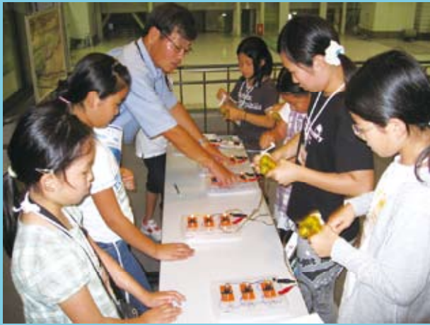
7月28日・29日、「子ども環境教室」を開催。225人の小学生が、電気やガスに関する施設を見学し、発電の仕組みや環境問題について学習しました。