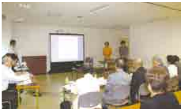
昨年のプレゼン審査の様子