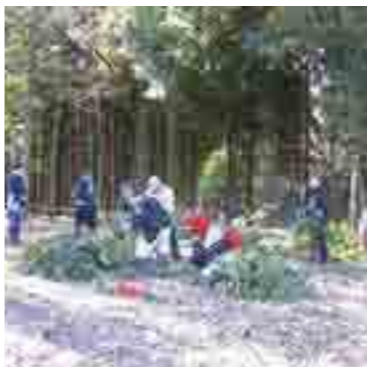
補助団体の活動の様子