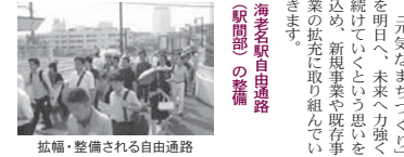
拡幅・整備される自由通路

元気なまちづくりを明日へ、未来へ力強く続けていくという思いを込め、新規事業や既存事業の拡充に取り組みしていきます。