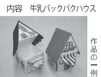
内容 牛乳パックハウス