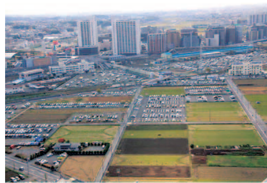
▲海老名駅西口土地区画整理予定地

後期基本計画 基本的には前期基本計画を継承したものとなっております。基本構想で掲げた市の将来環境や産業などの政策を分野ごとに示した政策別計画と、地域の実情に応じて取り組むべき事業を示した地域別計画から構成されています。