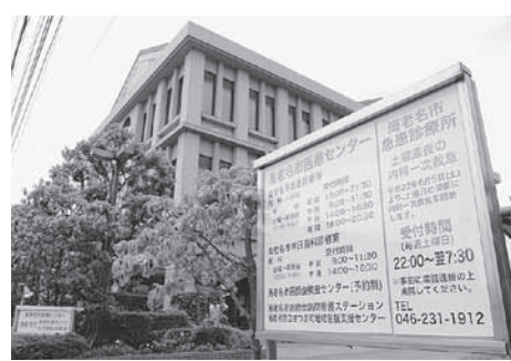
▲海老名市医療センター