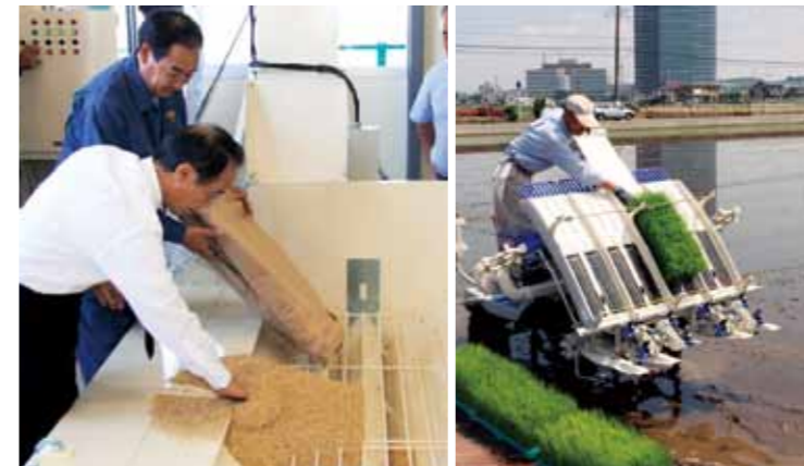
(左：ライスセンターでのもみすり 右：貸し出している田植え機)

これらも他自治体では例のない取り組みで、農地所有者が安心して継続的に農業に従事できるようにするための支援のひとつです。