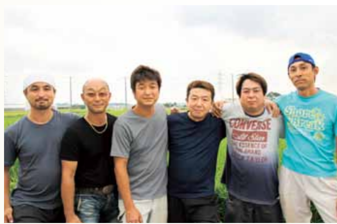
▲JAさがみ海老名市青壮年部の皆さん

青壮年部は全国の農協のほとんどに存在している若手を中心とした下部組織で、海老名の場合は現在、50歳までの55人で構成されています。