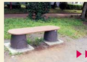
通常(ベンチ)使用時