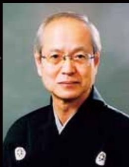
▲野村万作 2007年、人間国宝に認定される。狂言方和泉流の能楽師で、「万作の会」主宰。戦後の伝統芸能不遇の時代から狂言の普及に努め、広い支持を集めている。