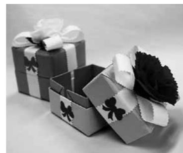
▲内容 「母の日・父の日ギフトボックス」ほか

子どもたちが簡単な工作と遊びを楽しむ教室です。費用無料。直接会場へ。 ▼対象 小学生(未就学児も保護者同伴で参加可能ですが、小学生が多い場合はご遠慮いただくこともあります。未就学児が参加できる時間は15時まで。) ▼時間 14時～16時20分 ▼その他 状況により、内容が変更になる場合があります。