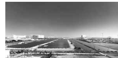
▲浮島太陽光発電所

太陽光発電(メガソーラー)などの施設や、ペットボトルのリサイクル工場へのバス見学会を実施します。 ☎3月15日(金)9時～16時30分 場 かわさきエコ暮らし未来館・ペトリファインテクノロジー(株) 対 市内在住・在勤・在学の18歳以上の方 定 40人(応募多数の場合は抽選) 費 500円(昼食代など) 申 住所・氏名・年齢・電話番号を、直接またははがき・ファクスで環境みどり課へ。3月1日(金)必着。