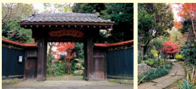
▲緑に囲まれた今福薬医門公園。静かで安らぐ場所です

平成16年5月、海老名市の旧家のひとつである今福家より、旧屋敷跡の一部が市に寄贈されました。嘉永6年(1853)に新築上棟された総檜造りの表門や、弘化4年(1847)に建てられた3階建ての文庫蔵は、歴史的建造物としても貴重な遺構です。また、園内には四季折々50種類以上の草花が咲き、訪れる人々に癒しの空間を与えてくれます。