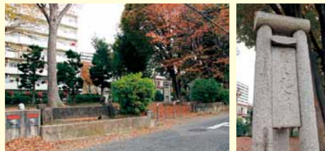
▲著名な教育者・大島正健氏の生家跡としても知られています

公園の北にある海源寺には、市文化財の大島豊後守正時坐像があります。正時は、室町時代の安房の国(千葉県)の武将でしたが、海老名の領主海老名広治の招請により、領地争いの救援のため海老名にやってきたといわれています。その後、血筋が絶えた海老名氏に代わり、この地を領有するようになったとされ、現在に至るまでその家系を保っています。公園名は、子孫である大島氏が屋敷の一部を市に寄付したことによるもので、園内には大島氏の由来を刻んだ記念石碑が建っています。敷地面積は約1,600平方メートル。