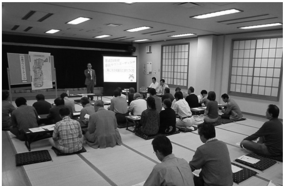
▲社家コミセン会場での市長タウンミーティング

なお、リニューアル後は地下から4階までが図書館として利用できるなど、サービス面も充実する。利用者が増えれば図書館に「にぎわい」が創出される。ただし、「にぎわい」は「うるさい」ではない。