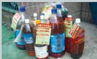
▲事業系ごみと思われる大量の油

ごみ集積所に、飲食店や個人事務所などから出される事業系ごみの不法投棄が急増しています。事業系ごみは一般のごみ集積所には出せません。一般廃棄物収集運搬の許可業者に収集を依頼するなど、正しく処理をしてください。事業系ごみと思われるごみの不法投棄を目撃した場合は、資源対策課まで連絡をお願いします。