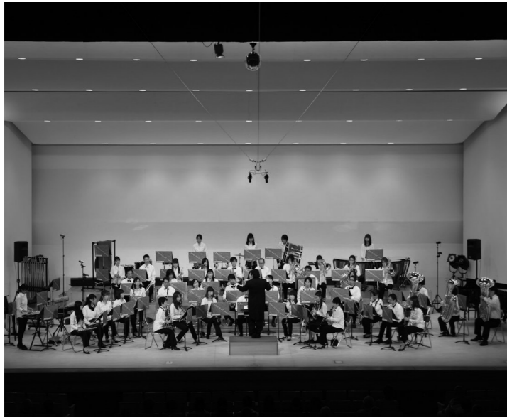
▲昨年文化会館で開催した海老名市民吹奏楽団定期演奏会の様子