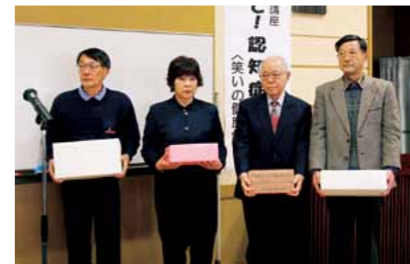
▲特産品を受け取る、25年度中に活発な活動をされたクラブ会員の皆さん