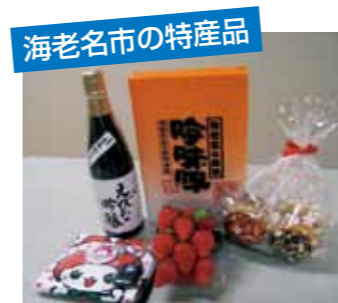
海老名市の特産品 イチゴ・吟味豚など