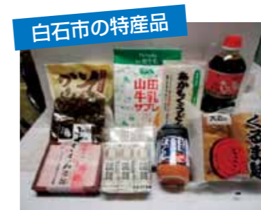
白石市の特産品 うどん・醤油など