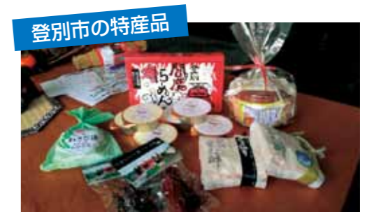
登別市の特産品 閣魔ラーメン・わさび漬けなど