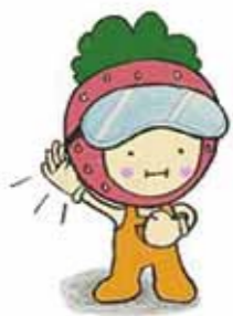
海老名市自殺予防対策キャラクター「こちこちくん」

あなたの周りに、悩みを抱えて苦しんでいる人はいませんか? 気になる人には優しく声をかけてみてください。