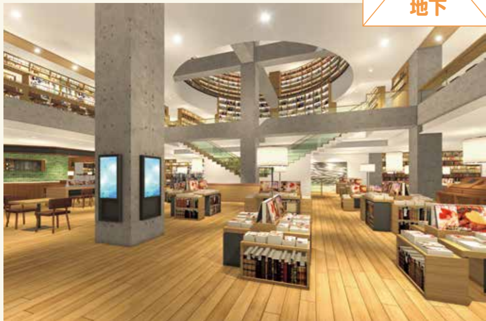
▲フローリング張りの床と2階への吹き抜けが温かみのある空間を演出。販売されている雑誌も自由に読むことができます

図書の貸し出し・返却などの従来の機能に加え、新たに書籍販売やカフェのスペースを配置。図書館の本はもちろん、販売されている新刊雑誌なども、コーヒーを飲みながら楽しむことができます。また、屋外にはウッドテラスを設置。季節の移ろいを感じながらゆったりと読書を楽しむことができます。