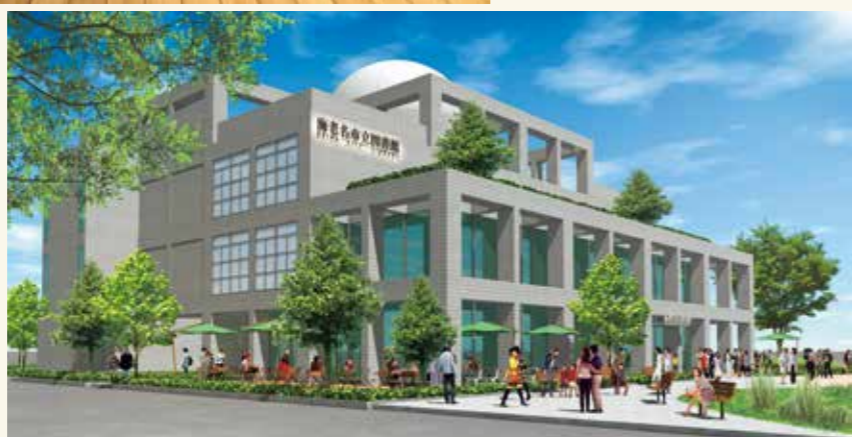
屋外に設置するウッドテラス▶と外観イメージ