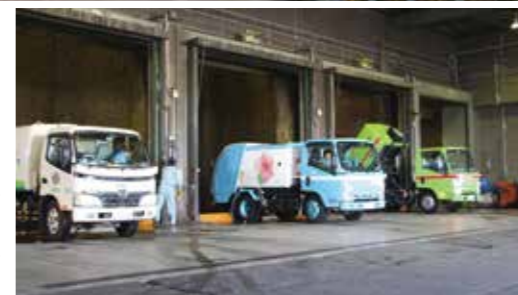
▶海老名・座間・綾瀬の3市のごみが次々と搬入されるごみピット。ピットには、3市から搬入されるごみの2.5日分を入れることができます

同組合では、3市から排出された燃やせるごみ(一般廃棄物)を、焼却施設(1日当たり処理能力150トン)昭和59年完成と、同200トン(平成4年完成)と粗大ごみ処理施設(同50トン(昭和49年完成))で処理しています。これらの施設は老朽化が著しく、更新が必要となっています。