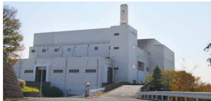
▲現在の焼却炉。ごみを定量ずつ投入し、850度以上で燃やす「流動床式焼却炉」を採用しています