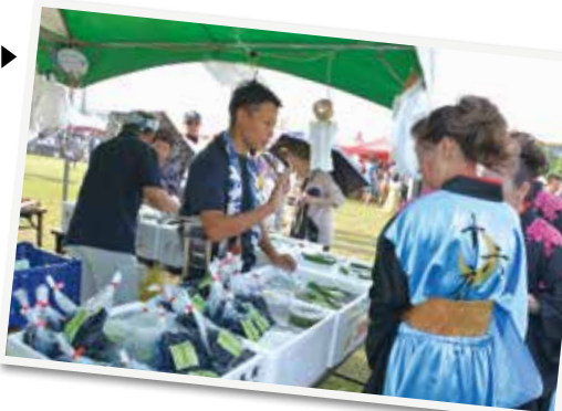
物販ブースには姉妹都市の特産品が並びます

▼その他 先着順販売。残数が出た場合はまつり当日に販売。購入は、窓口に来た方1人につき10枚まで。チケットの再発行は不可。花火中止時は、7月27日(水)～8月19日(金)の間、同事務局でチケットと交換で返金します。