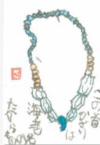
▲上今泉横穴墓出土玉類