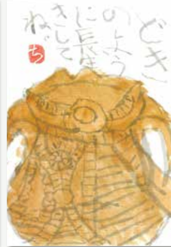
▲杉久保遺跡出土縄文土器