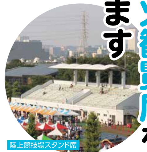
陸上競技場スタンド席

有料観覧席での花火鑑賞は事前申し込み制です。希望する方は、次の方法で申し込みをしてください。