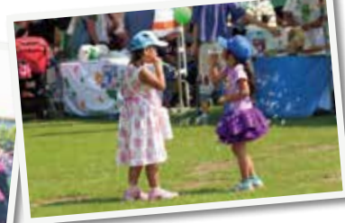
▲帽子をかぶるなど、十分な熱中症対策をお願いします