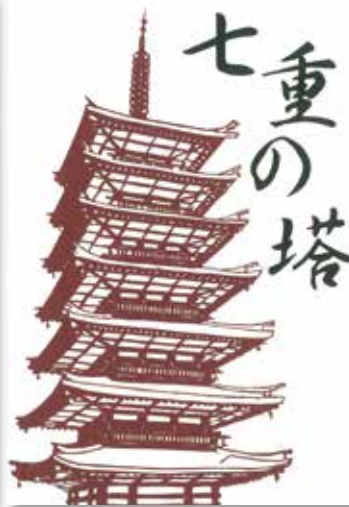
▲相模国分寺七重塔