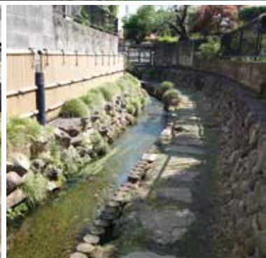
▲亀島自然公園の湧水が流れる産川沿いの小道