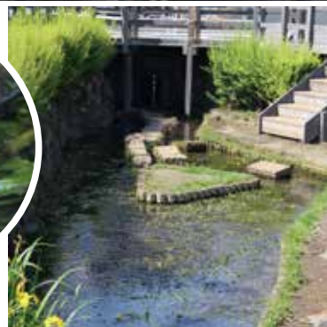
▲絶滅危惧種のコウホネの花が咲く北部公園向かいの「産川せせらぎ公園」