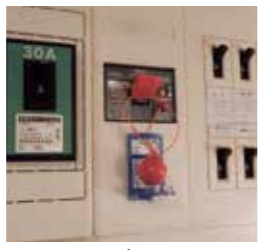
▲設置工事が不要な簡易型

地域防災力を強化するため、設置を希望する自治会の自主防災組織に対し、感震ブレイカーの設置費用を補助します。