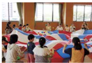
▲子育て支援センター

子育て支援センターで実施している育児相談や子育てサロンなどをより身近なものとするため、「地域版子育て支援センター」を設置します。