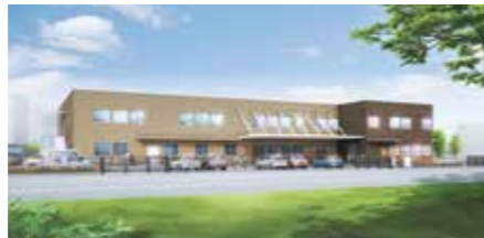
▲平成30年4月開所予定の障がい者第三デイサービスセンター(あきば)イメージ

市北部の障がい者施策の拠点施設として、障がい者第三デイサービスセンター(あきば)を建設します。生活介護や就労支援を行うほか、日中一時・短期入所など新たな事業を推進します。