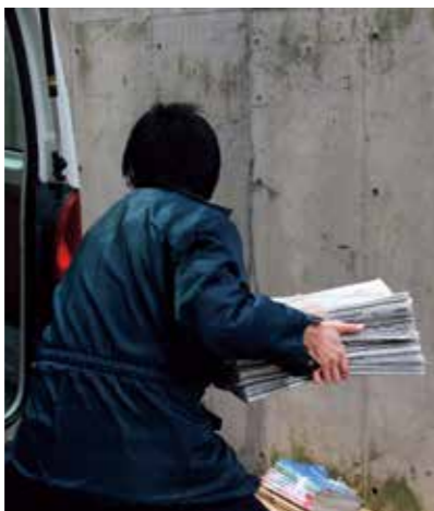
▲未明から早朝に多い持ち去り行為。外が明るくなってから8時30分までに出すようにしてください

持ち去り行為者と接触するのは危険です。接触せずに、次にあげる情報提供のご協力をお願いします。なお、身の危険を感じた場合は、ただちに警察へ通報してください。