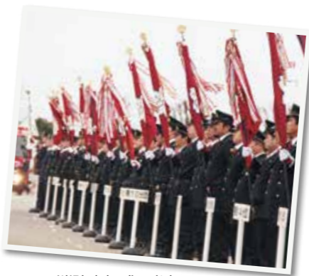
▲消防出初式に参加

現在、市には15の消防分団があり、192人(女性1人含む)が消防団員として活動しています。災害などの非常事態から地域を守るためには、多くの力が必要です。団員は随時募集中。市内在住・在勤で、18歳以上の健康な方であれば男女は問いません。お気軽に消防総務課へお問い合わせください。