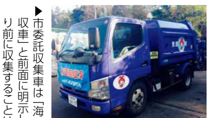
▶市委託収集車は「海老名市資源回収車」と前面に明示し、8時30分より前に収集することはありません