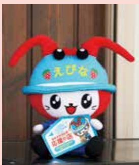
▲消防団員に扮したえびにゃにも会えるかも

現在、この制度に賛同した飲食店や居酒屋、理美容院、スポーツ整体など、市内の91店舗でサービスが実施されており、対象店舗にはステッカーやのぼり旗が掲出されています。団員の入団促進と地域経済の活性化のため、賛同店舗も随時募集しています。ぜひご協力ください。