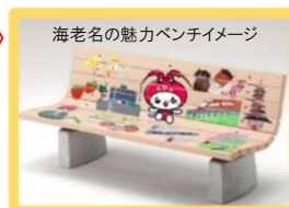
海老名の魅力ベンチイメージ

子どもたちが描いた海老名の魅力をデザインしたベンチを設置し、訪れた方がSNS等で発信することで、市の認知度向上に繋げていきます。