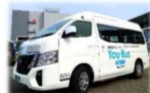
You Bus 運行車両

既存の地域公共交通では対応しきれないきめ細やかな移動支援を目指し、現在、下今泉地区において実施しているYou Bus実証運行を門沢橋地区においても開始します。