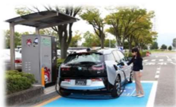
電気自動車急速充電器

電気自動車の普及を促進するため、市役所前に設置している電気自動車の急速充電器を再整備します。