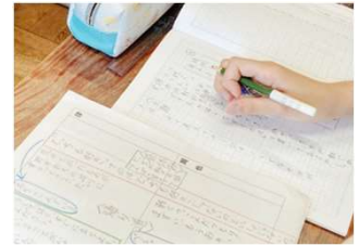
学校教材のイメージ