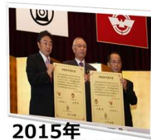
2015年 3市でトライアングル 姉妹都市結成

宮城県白石市と姉妹都市を締結して30周年を迎えることから、「30周年記念式典」を行います。