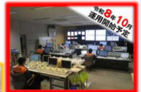
消防通信指令センターイメージ

三市消防指令センターについて、大和市を加え、現状の3市(海老名市、座間市、綾瀬市)から4市での共同運用とし、災害情報を一元化することにより応援体制の充実強化を図ります。