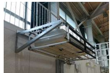
空調機設置イメージ